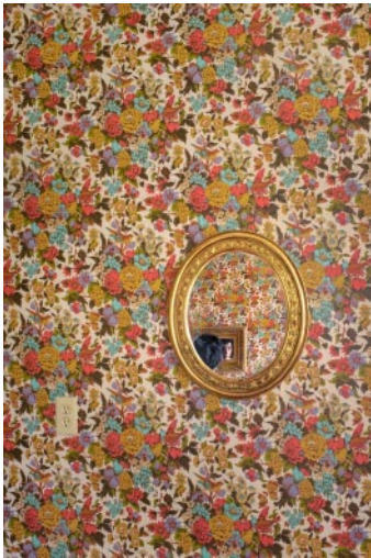
03_© Jo Ann Chaus