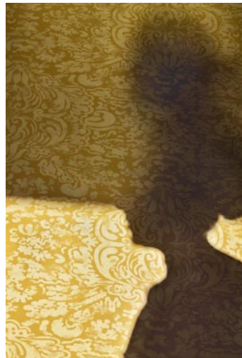
06_© Jo Ann Chaus