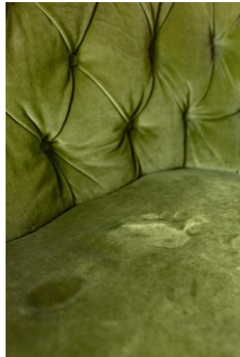
04_© Jo Ann Chaus