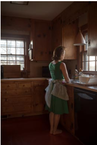
05_© Jo Ann Chaus